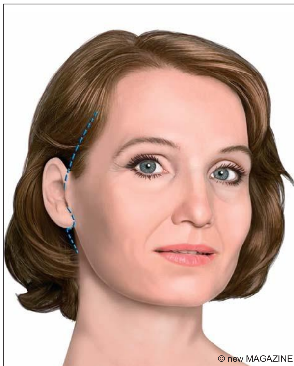
Figura 6. Lifting cervico-facciale: in evidenza le incisioni.

abbondante bendaggio, in modo da mantenere una moderata compressione su tutta l'area operata, per ridurre il gonfiore (edema) e per proteggere le ferite. Dalla pelle dietro le orecchie possono essere fatti fuoriuscire due piccoli drenaggi (tubicini di materiale plastico) per ridurre il rischio di ematomi.