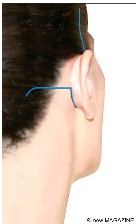
Figura 7. Lifting cervico-facciale: le incisioni.

Dopo questo tipo di intervento, il dolore non è forte e di norma è controllabile con i comuni analgesici. Dovrà essere evitato l'uso di farmaci contenenti acido acetilsalicilico che potrebbero provocare sanguinamenti e quindi la formazione di ematomi. Spesso il dolore coincide con la sensazione di tensione, ovviamente connaturata a questo tipo di intervento, alla quale ci si abitua progressivamente fino a non avvertirla più dopo alcune settimane.