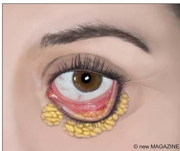
Figura 12. Blefaroplastica inferiore mediante accesso transcongiuntivale.

piccola striscia di muscolo orbicolare e la riduzione delle borse adipose. Dopo un'attenta emostasi si procede alla sutura con punti sottili e alla medicazione. L'intervento alla palpebra inferiore può essere condotto per via esterna o attraverso un'incisione transcongiuntivale. Nel primo caso (blefaroplastica per via esterna) è condotto attraverso un'incisione che decorre pochi millimetri sotto la linea delle ciglia e si prolunga di poco lateralmente all'angolo esterno dell'occhio. Le borse adipose, secondo le tecniche, possono essere ridotte (asportate) o riposizionate per correggere eventuali difetti a livello del solco lacrimale (occhiaie). Si procede quindi alla rimozione della cute, se in eccesso, all'emostasi e alla sutura. Nel secondo caso (blefaroplastica transcongiuntivale), l'incisione è eseguita solo attraverso la congiuntiva (faccia interna della palpebra inferiore). L'eventuale eccesso cutaneo è corretto con incisione cutanea subciliare o con tecniche alternative (laser assistite o peeling chimici).