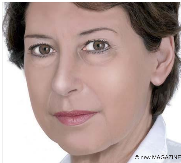
Figura 9. Blefaroplastica: aspetto pre-operatorio.

Il giorno dell’intervento è opportuno non eseguire il make-up del viso e dell’area perioculare e rimuovere